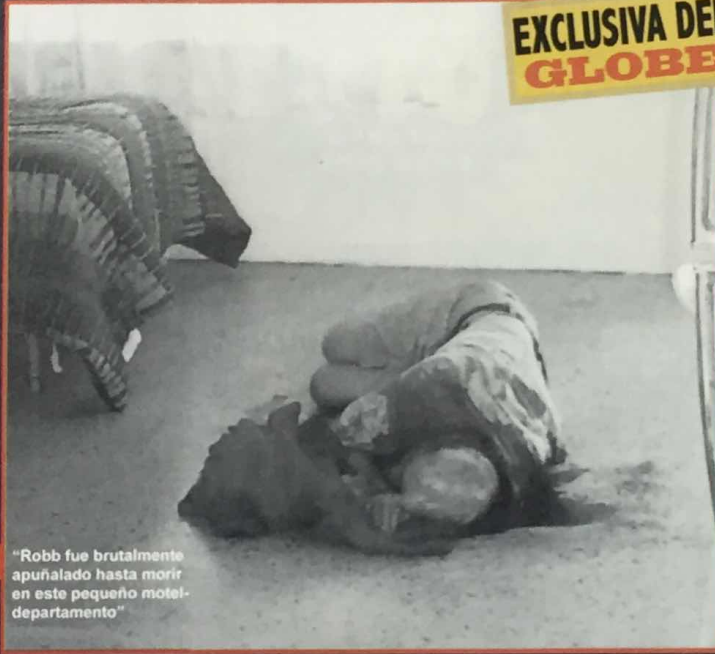
"Robb fue brutalmente apuñalado hasta morir en este pequeño motel-departamento"